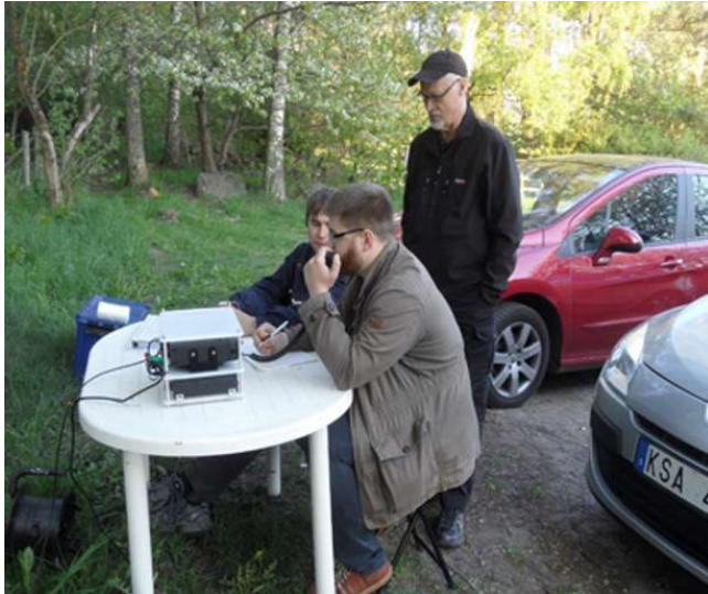
Field-day vid Fjälkinge backe.